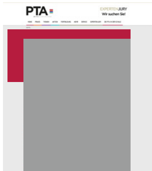
Wallpaper small 960 x 90 + 160 x 600 Pixel