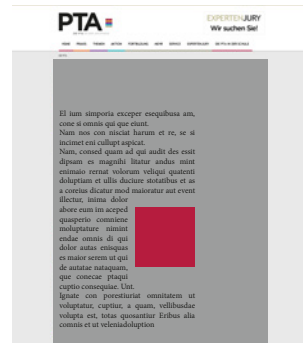
Medium Rectangle 300 x 300 Pixel