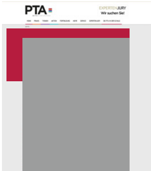
Wallpaper small 980 x 90 + 160 x 600 Pixel