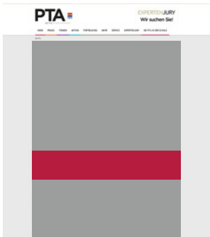
Fullsize Banner large 620 x 120 Pixel