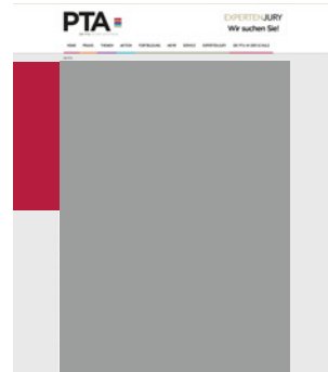
Skyscraper large 260 x 600 Pixel