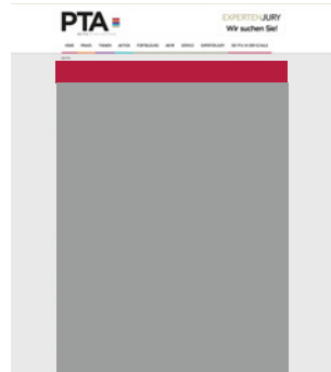
Superbanner small 960 x 90 Pixel