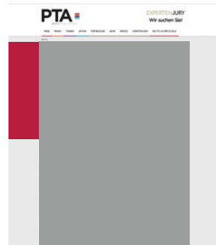
Skyscraper large 260 x 600 Pixel