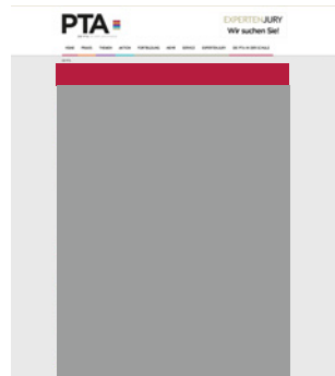
Superbanner small 960 x 90 Pixel