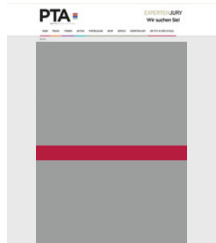
Fullsize Banner small 620 x 60 Pixel