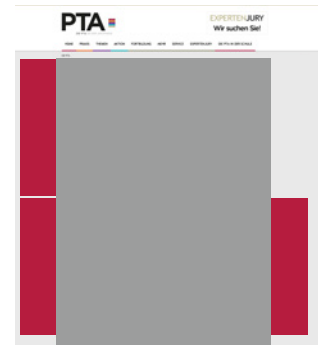
Skyscraper small 160 x 600 Pixel