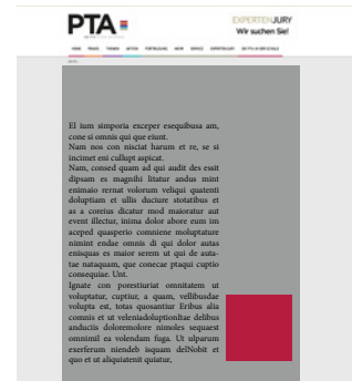
Square Button 300 x 300 Pixel