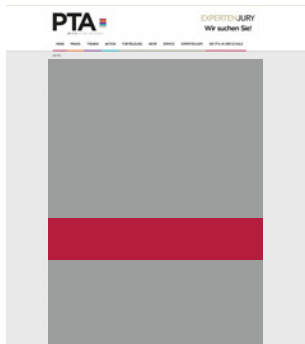
Fullsize Banner large 620 x 120 Pixel