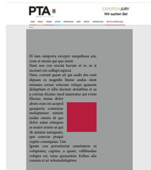
Medium Rectangle 300 x 300 Pixel